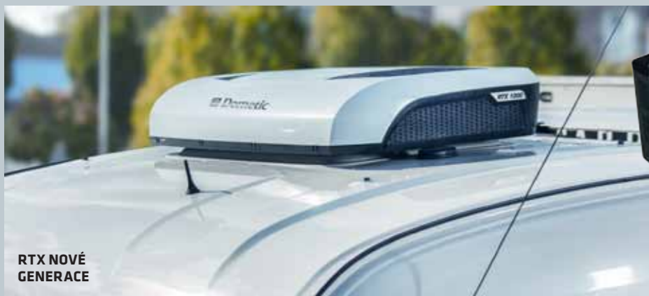
RTX NOVÉ GENERACE

Společnost DALIX, s.r.o. , která se specializuje na mobilní chlazení, působí na českém trhu více jak dvacet let. Úzce spolupracuje se světovými leadery v daném oboru a nabízí jejich produkty.