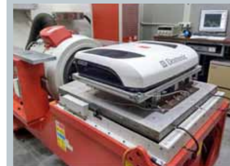
TESTOVÁNÍ NA CERTIFIKOVANÉ ZKUŠEBNÍ STOLICI

CO je vysoce výkonný a hlavně spolehlivý rotační kompresor s cirkulací ekologického chladiva, nevyžadující žádnou údržbu.